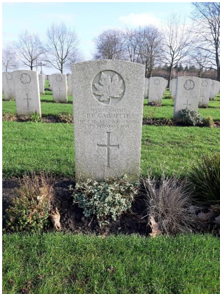
Groesbeek, 19 februari 2020